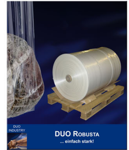
DUO INDUSTRY DUO ROBUSTA ... einfach stark!

DUO PRINT Bedruckte Stretchfolie in allen Ausführungen