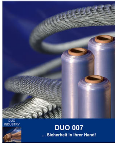
DUO INDUSTRY DUO 007 ... Sicherheit in Ihrer Hand!

DUO DOPPELKANTE Die mit dem Deutschen Verpackungspreis und der PIF Gold Medal prämierte Stretchfolie