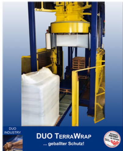
DUO INDUSTRY DUO TERRAWRAP ... geballter Schutz!

DUO ROBUSTA Dehnschlauch als innovative Weiterentwicklung für die Transportsicherung mit Dehnfolien