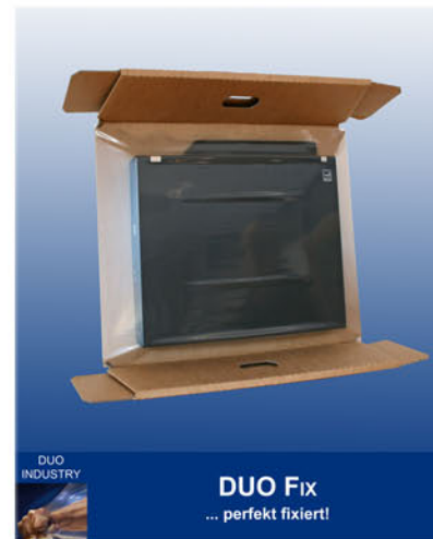
DUO INDUSTRY DUO Fix ... perfekt fixiert!

DUO STRAP Die speziell für das Umreifen und Bündeln von Waren entwickelte Banderolierfolie