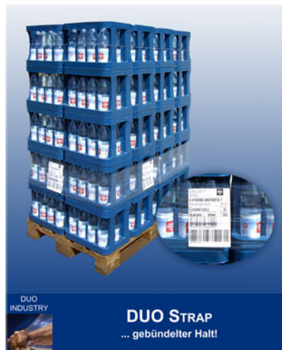
DUO INDUSTRY DUO STRAP ... gebündelter Halt!

DUO TERRAWRAP Die stärkenreduzierte Spezialfolie für die Ballen-Verpackung