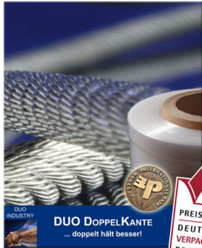
DUO INDUSTRY DUO DOPPELKANTE ... doppelt hält besser!